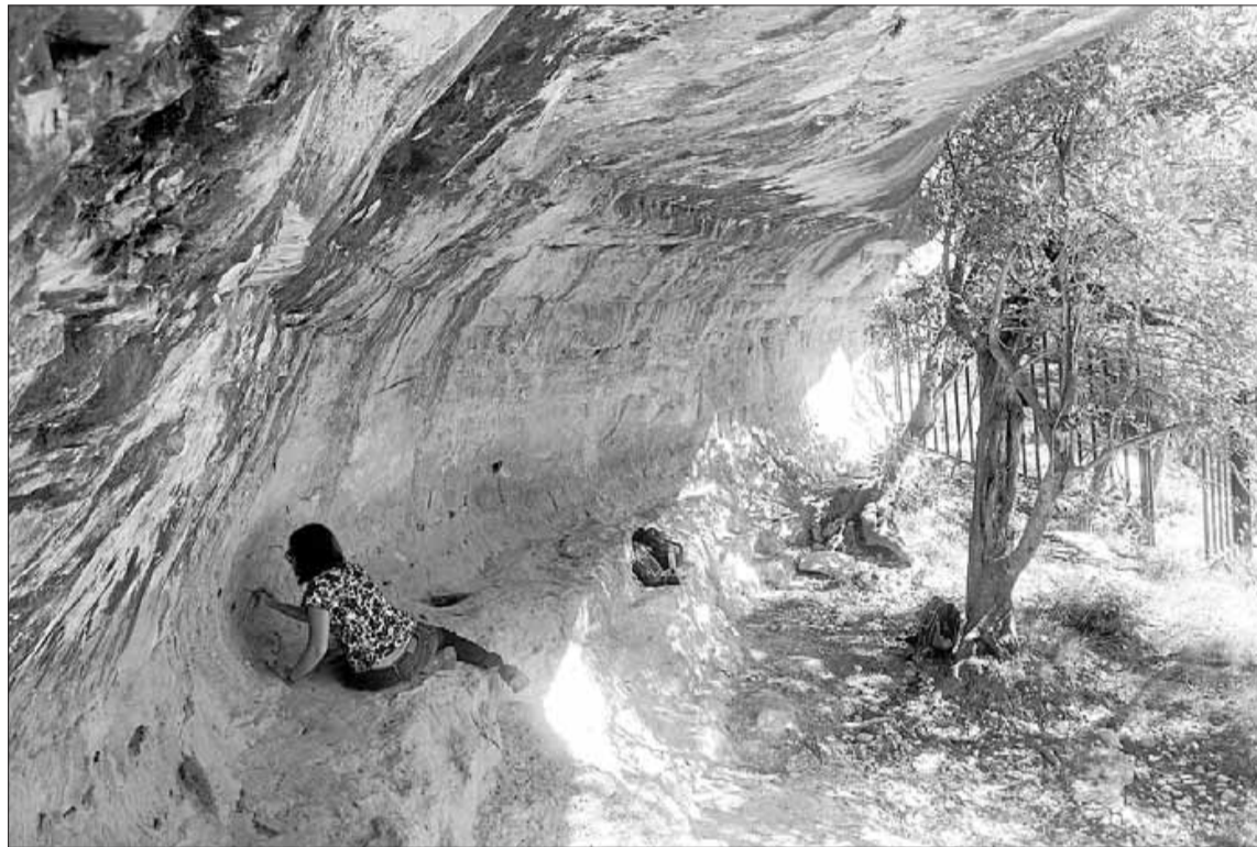
Una restauradora trabaja desde la semana pasada en el Abrigo del Garrofero de Navarrés.